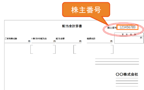
配当金計算書（直近では、2023年3月30日 発送）