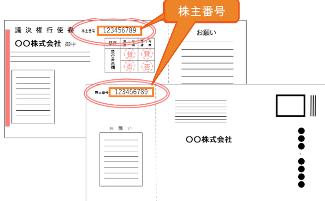
議決権行使書（直近では、2023年3月15日 発送）