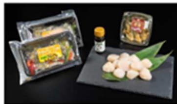
1コース 三段座 旨味たっぷりホタテとカキのセット ※冷凍