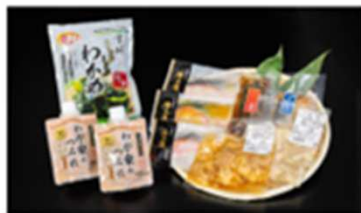
3コース 女川いっぱい!おなかはいっぱい!あつたかごはんセット ※冷凍