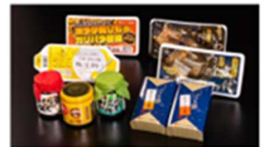
2コース 女川産製!涙の母ちゃんおもてなしセット ※常温