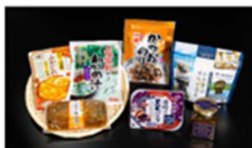
6コース また食べたい!気仙沼の逸品セット ※常温