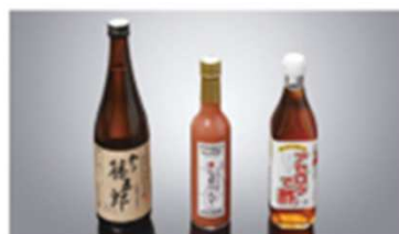
7コース 五稜山元、復興への挑戦ギフト ※常温