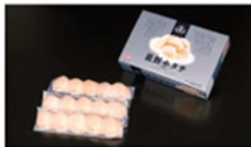
0コース 特別コース 最鮮ホタテ [三段座] (冷凍、生食用) ※冷凍

※9コース「釜石厳選!お手軽グルメセット」でござりますが、生産者の都合により、「まるまるいわし 昆布味噌煮」を「まるまるさば 昆布味噌煮」に代えお届けいたします。