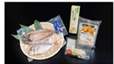
5コース 石巻からあつたけ-うまいものセット ※冷凍