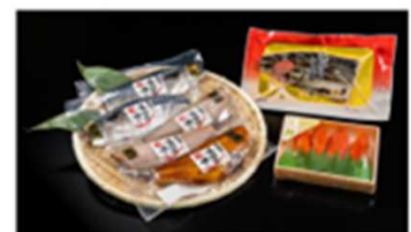
8コース 仙台市場、厳選詰め合わせセット ※冷凍