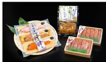
4コース 選ばれし石巻うまいもの祭りセット ※冷凍