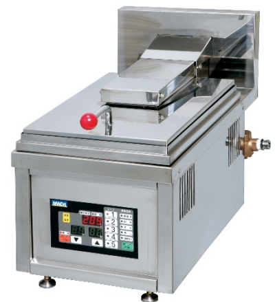
1台で多品目の調理が可能な 全自動多機能調理器マルチグリラー

本展は、ホテル・旅館・観光・各種施設の『国際ホテル・レストラン・ショー』、給食・中食・弁当の『フード・ケータリングショー』、厨房・フードサービスの『厨房設備機器展』の3つの展示会で構成された、ホスピタリティとフードサービスの商談専門展示会『HCJ』においての開催となります。約1000社/2,600ブースで厨房機器や生産性向上の製品・サービス、ホスピタリティデザイン関連製品等が展示され、8つの特設会場でホテル・レストラン・サービス業のためのセミナーが開催されます。