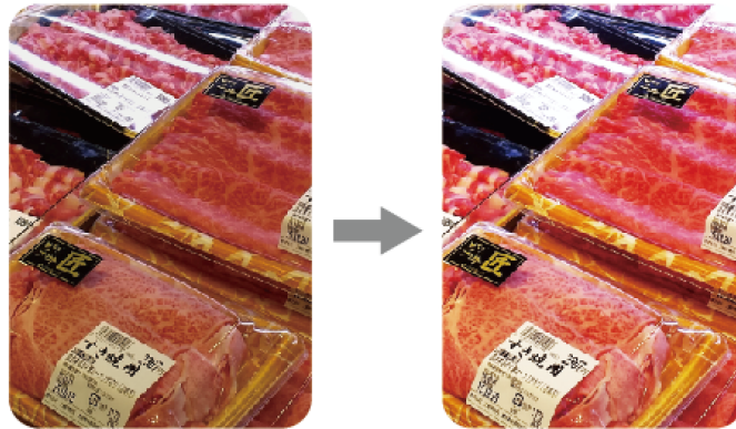
※LME1200S (ME+2) クリア使用時イメージ